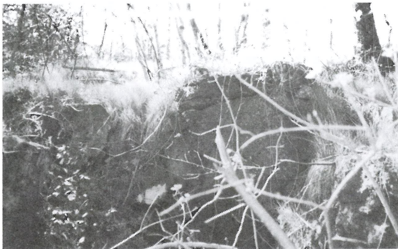
Anlegget for vannrennen ligger på skrenten rett bak studenthjemmet, ca. 15 meter inn fra gangveien opp til Groosedammen.

At det måtte anlegges en eller flere stemmer, var klart, men hvor og i hvilken rekkefølge de ble bygget er usikkert. Det eneste vi med sikkerhet kan si er at